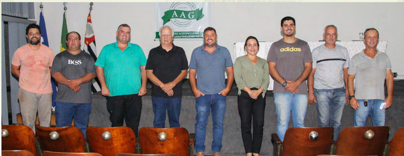
Atual Diretoria da Associação Agropecuária de Guaratinguetá e Região - 2025/2029

Fundada em 1936, a nossa Associação inicialmente chamava-se Sociedade Agropecuária. Com o objetivo de estar sempre ao lado do homem do campo, valorizando o espírito associativista, foi criada pelo envolvimento de 169 ruralistas que assinaram a primeira ata da entidade.