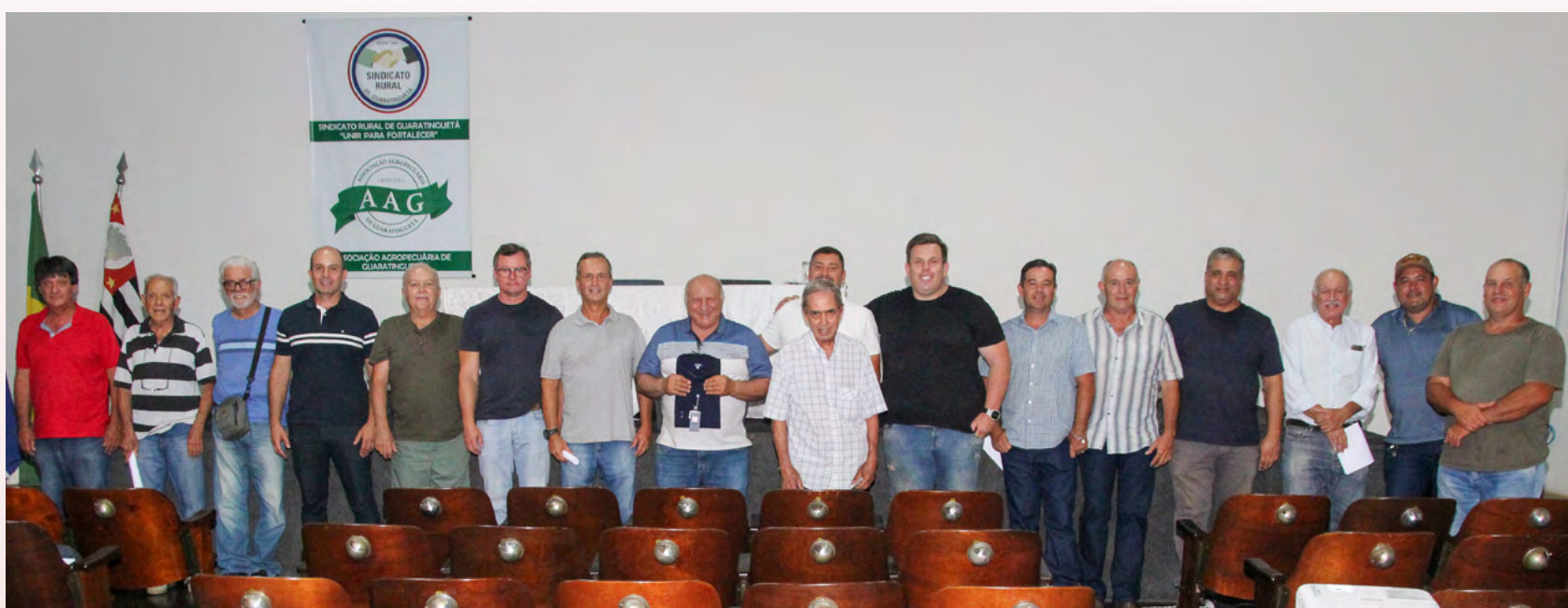
Atual Diretoria do Sindicato Rural de Guaratinguetá - 2025/2028

Com o crescimento do número de associados, em 14 de outubro de 1966, é criado o Sindicato Rural de Guaratinguetá para ser um representante da categoria. A carta sindical reconheceria a entidade a partir do dia 11 de julho de 1967, tendo como base de atuação Guaratinguetá,