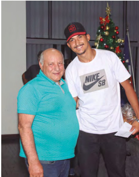
Ganhou R$ 100,00