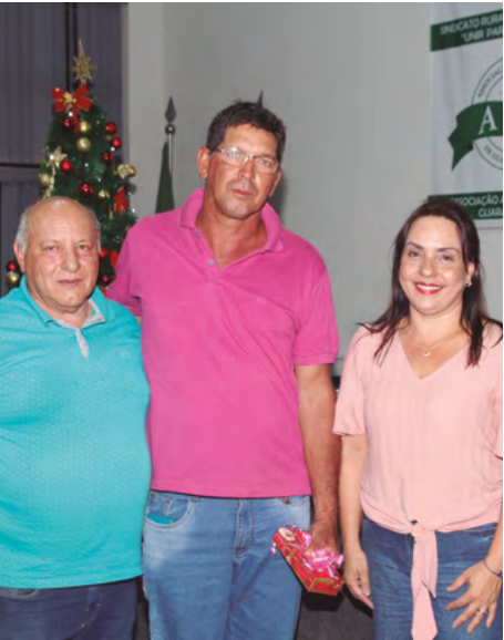
Ganhou um celular

A Festa dos Trabalhadores Rurais de Guaratinguetá foi realizada no dia 28 de novembro, no auditório da Associação, com sorteio de presentes, distribuição de panetones e coquetel. Confira os três ganhadores dos prêmios principais: