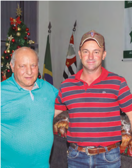
Ganhou um presente da GoldFinger