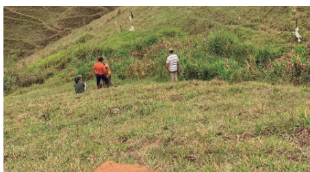
Fig 1: Situação inicial da área (09/2022)

https://portal.fgv.br/noticias/recuperacao-pastagens-degradadas-custaria-r-383-bilhoes-revela-observatorio-bioeconomia .