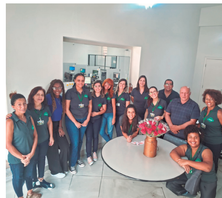
Café da Manhã das Mulheres no escritório de Guaratinguetá