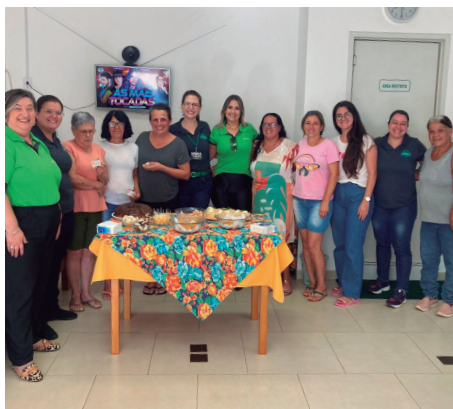
Café da Manhã das Mulheres no escritório de Lagoinha

Agradecemos o empenho das mulheres da Associação e a todas as associadas que passaram pelos escritórios e prestigiaram nosso café e a presença feminina no agro!