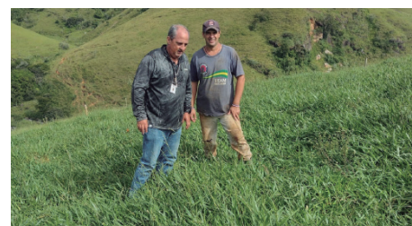
Fig 2: Situação da área (10/2023)

As Fig 1 e Fig 2 ilustram o resultado obtido do processo de vedação de uma gleba de 1,7ha, realizada no município de Bananal. A gleba ficou vedada por 5 meses, para recomposição inicial das plantas forrageiras. Após esse período, ela foi dividida em 29 Piquetes de 600m 2 , que foram utilizados na estação chuvosa, sustentando uma lotação de 4 vacas em lactação (2,3 cab/ha). Durante o período de utilização, os piquetes foram adubados na saída do pastejo com uréia. A primeira correção de fertilidade do solo da área foi realizada no segundo ano de utilização da gleba, permitindo ampliação da capacidade suporte para 7,0 cab/ha.